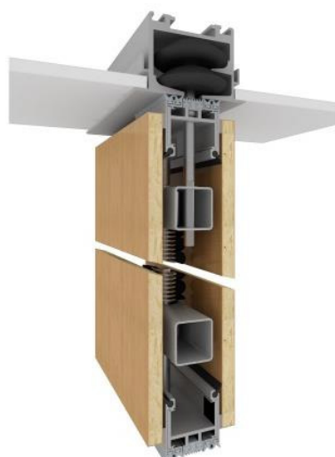
Dvoubodové zavěšení LIKO-Space 100